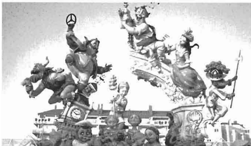
Falles 2007. Falla Nou Campanar 1er. Premi Sec. Especial

Esta teoria de que les falles naixquen com a conseqüència de la neteja de les fusteries la vespra de Sant Josep, condiciona la seua aparició, ja que no podria ser anterior al segle XVI, perquè fou, cap a finals d'este