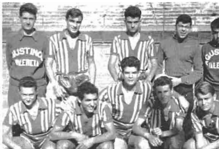
1957. Campeonato de España Escolar