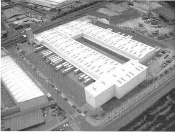
Base logística DHL valencia

cualquier otra circunstancia, así como en los de transferencia onerosa. En unos y otros debe dejarse muy claro todo el proceso de transferencia y la valoración de la parte de la empresa que se transfiere.