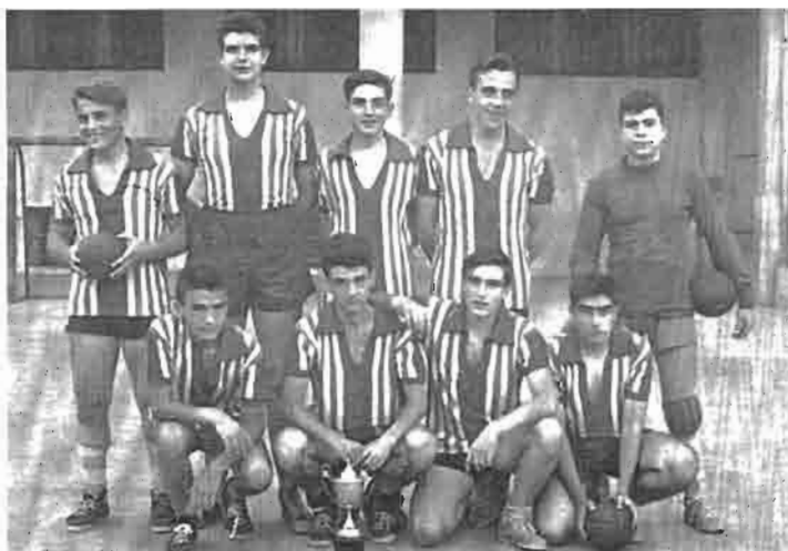
(1957/58) Equipo Agustinos durante el Torneo Escolar.