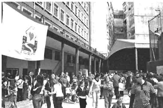
Fiesta Día de la Solidaridad Villa-Nueva

ONGD Villa-Nueva continúa su labor solidaria con los más necesitados de República Dominicana. Todos los que queráis colaborar lo podéis hacer entrando en la Web www.agustinos-valencia.net/ongvillanueva , donde os indicarán las distintas formas de