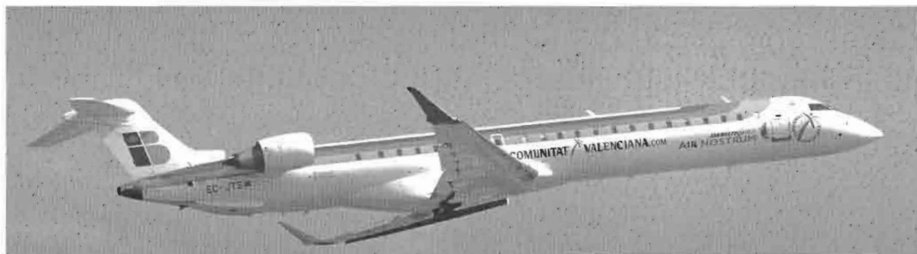
CRJ900. Avión reactor último modelo de la flota de Air Nostrum.

E innovación, porque gracias a Air Nostrum, Valencia es hoy, un punto de referencia para la aeronáutica mundial. Sin ir más lejos, hace unos meses, presentamos ante los medios de comunicación el Proyecto Giant, que permitirá que, dentro de diez años, los aviones de toda Europa puedan aterrizar guiados exclusivamente por satélite. De entre todas las aerolíneas posibles, la Unión Europea ha seleccionado exclusivamente a Air Nostrum para sus pruebas y los primeros aterrizajes de la historia dirigidos por este sistema se han realizado en el Aeropuerto de Valencia. Y yo me pregunto: ¿Pensamos alguna vez los valencianos que participaríamos en