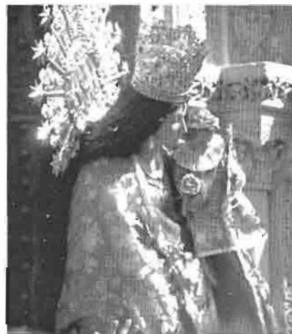
Traslado de la Virgen

A las ocho se celebra la “misa d’ infants” , que tiene como protagonista principal a los niños. Después tendrá lugar el traslado de la Virgen a la Catedral. Desde la Catedral, la Virgen realiza un recorrido apoteósico. Muchos valencianos intentan llegar, todos los años, hasta la Virgen para tocar y besar su manto. Destacan, también en el recorrido, frecuentes “espontáneos” que recitan poesías o frases cariñosas a la Virgen.